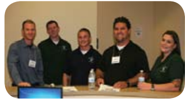
Durante una reciente recepción, personal de Community Bridges condujo visitas guiadas de Access Point y Transition Point.