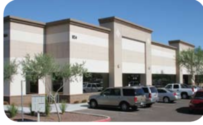
Access Point y Transition Point abrirán en agosto del 2011.

Magellan Health Services de Arizona, la Autoridad Regional de Salud Mental del centro de Arizona y Community Bridges, Inc., un proveedor de servicios integrados de salud mental en Arizona, lanzarán durante el mes de agosto los centros de salud mental Access Point y Transition Point en el oeste del valle. Ubicados en forma conjunta en el 824 N. 99th Avenue, Avondale, AZ, 85323, estos centros brindarán servicios de ingreso, de apoyo y de evaluación (Access Point) y servicios de residencia por tiempo limitado (Transition Point) para personas que tienen problemas de salud mental o de abuso de sustancias, las 24 horas del día, los siete días de la semana.